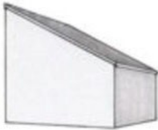
Tag med ensidigt fald

En bygning med ensidig taghældning vil passe godt ind i den øvrige bebyggelse i Rønde